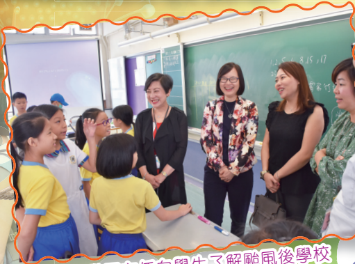
總學校發展主任向學生了解颱風後學校復課的感受