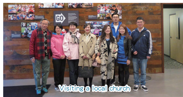
Visiting a local church