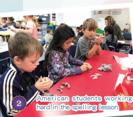
American students working hard in the spelling lesson