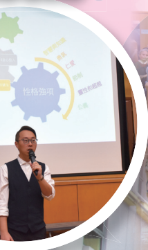
講者向學生介紹24個品格強項