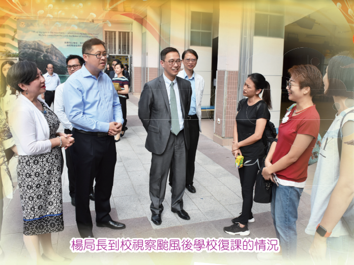
楊局長到校視察颱風後學校復課的情況