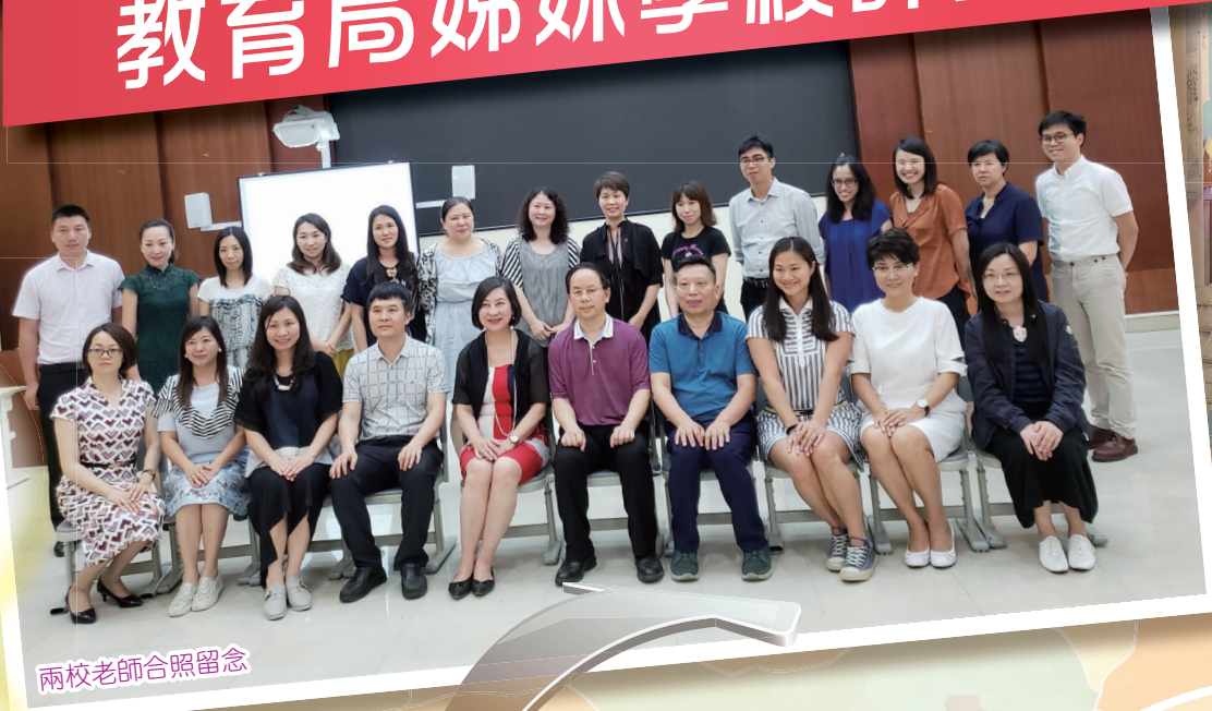
兩校老師合照留念