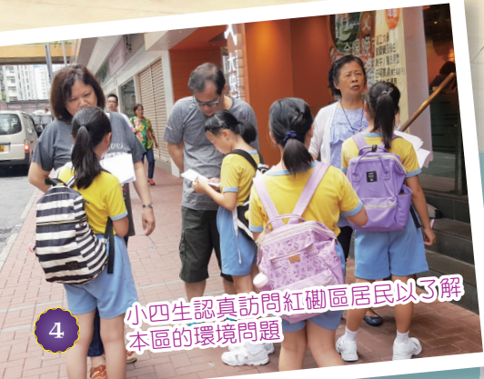
小四生認真訪問紅樹區居民以了解本區的環境問題