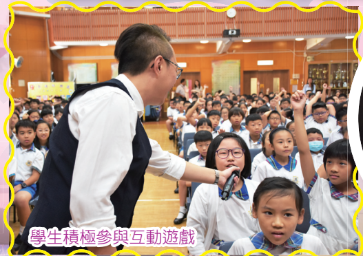
學生積極參與互動遊戲