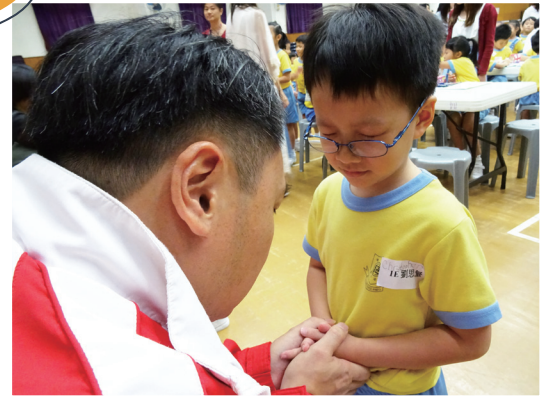
黃埔聯福堂的牧者為每一位小一新生祝福