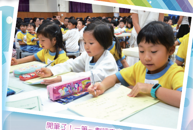
開筆了！一筆一劃認真寫！