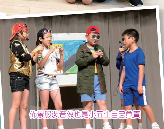
佈景服裝音效也是小五生自己負責