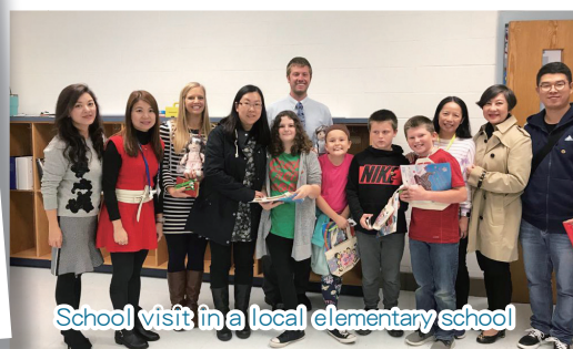
School visit in a local elementary school