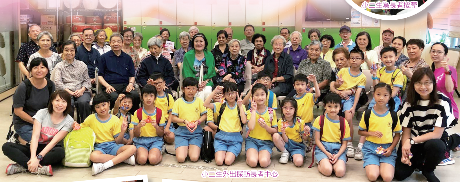
小三生外出探訪長者中心