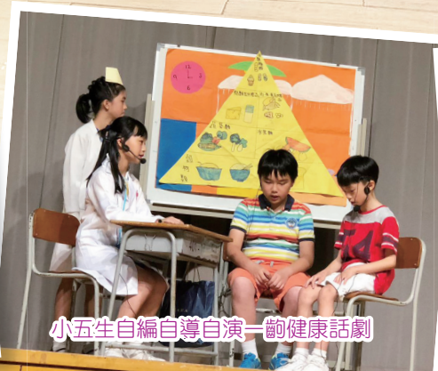
小五生自編自導自演一齣健康話劇