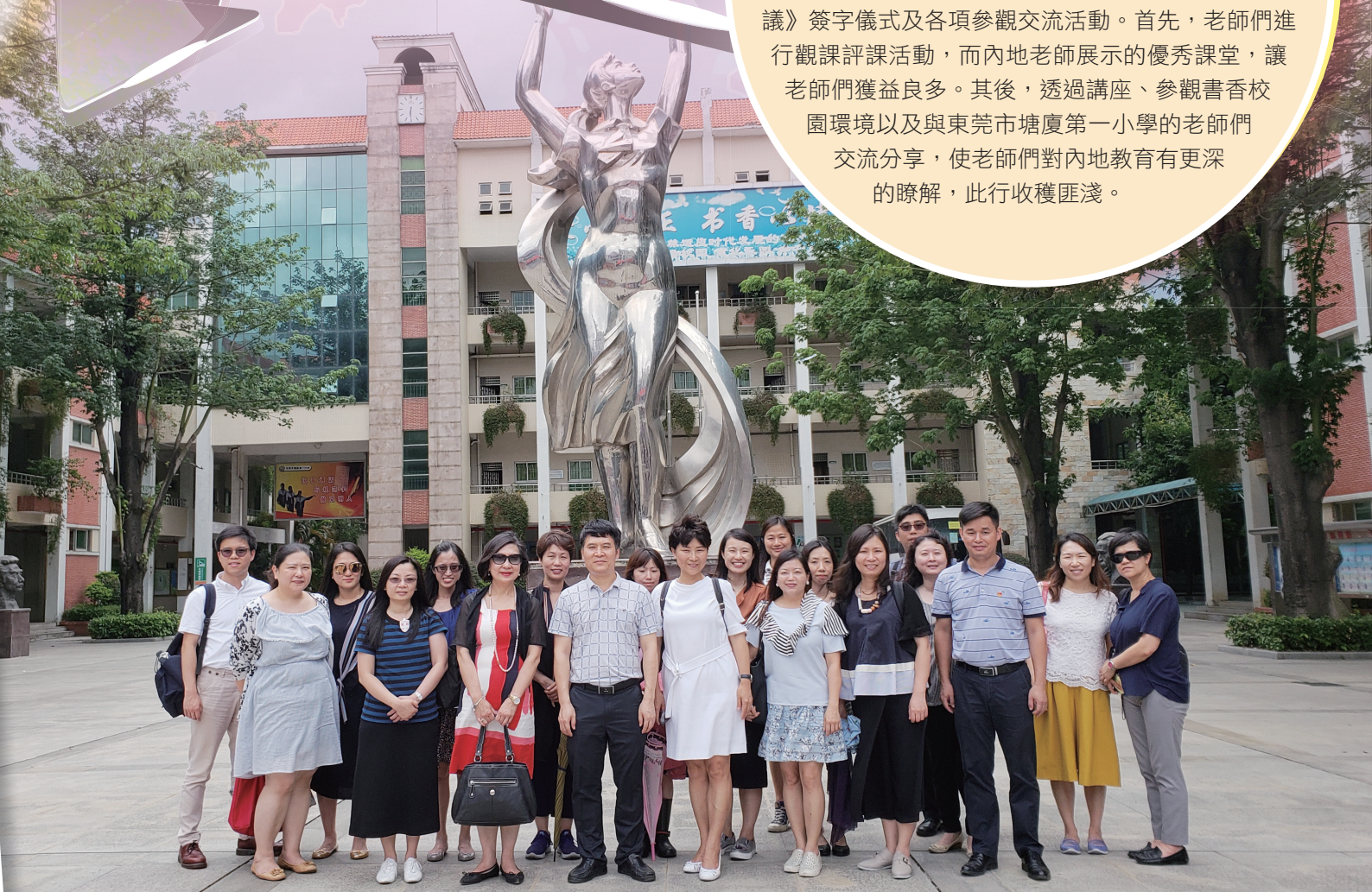
老師們在校園門前合照留念

2018年6月5日，蔡校長率領老師共18人前往內地姊妹學校——東莞市塘廈第一小學參與《友好協議》簽字儀式及各項參觀交流活動。首先，老師們進行觀課評課活動，而內地老師展示的優秀課堂，讓老師們獲益良多。其後，透過講座、參觀書香校園環境以及與東莞市塘廈第一小學的老師們交流分享，使老師們對內地教育有更深的瞭解，此行收穫匪淺。