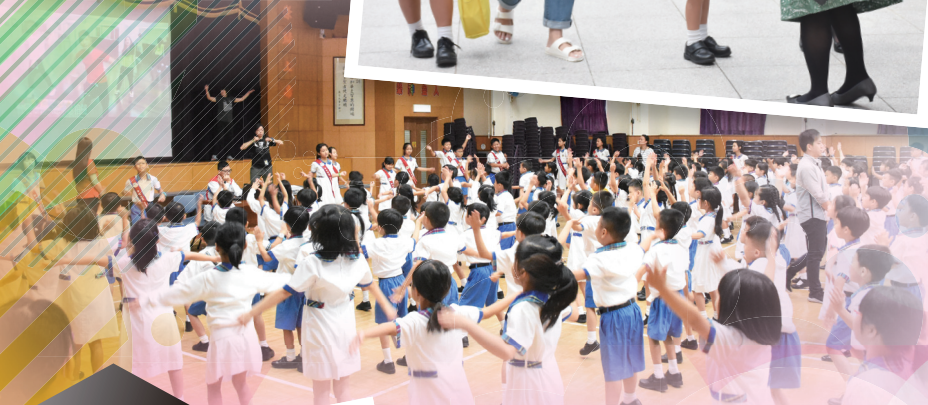
小一新生齊學活力操！