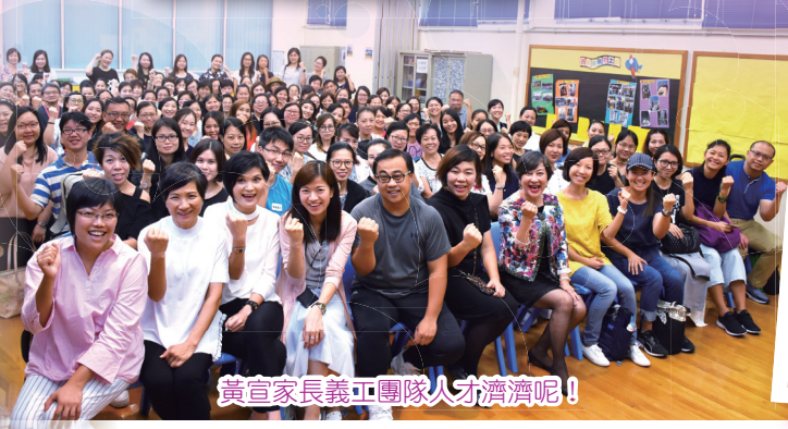
黃宣家長義工團隊人才濟濟呢！