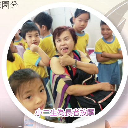
小三生為長者按摩

六年級學生以關懷社區為重點，了解社會上不同需要的人的所需，認識不同的社福機構，並身體力行參與善事，例如賣旗籌款、攤位義賣活動。