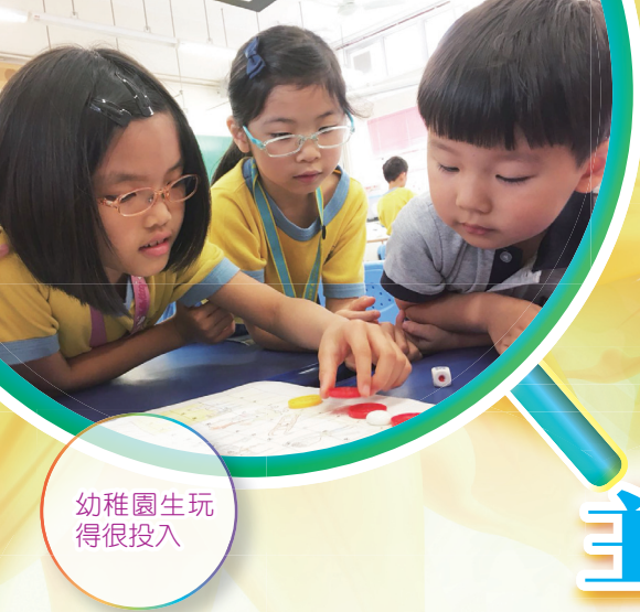
幼稚園生玩得很投入