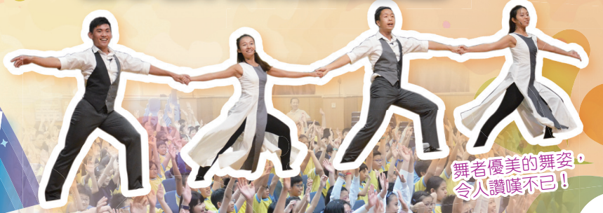
舞者優美的舞姿，令人讚嘆不已！