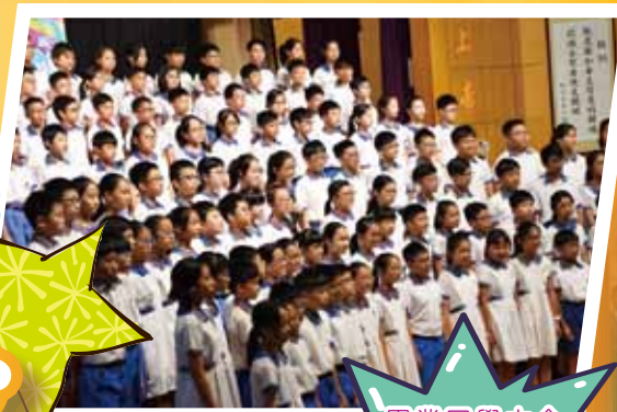
畢業同學大合唱，真是動人一刻！