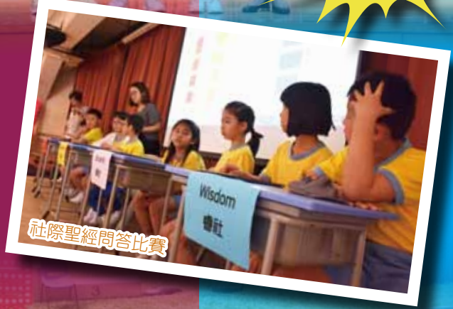
社際聖經問答比賽

整學年社際比賽及活動多姿多彩，學年末累計四社成績，最後由毅社奪得「2018-2019 社際全年總冠軍」。冀望來年同學們繼續積極參加各項社際活動！