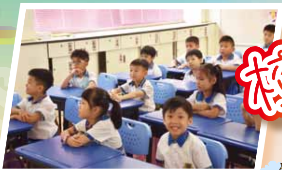
課室規則要遵守，同學們十分努力！