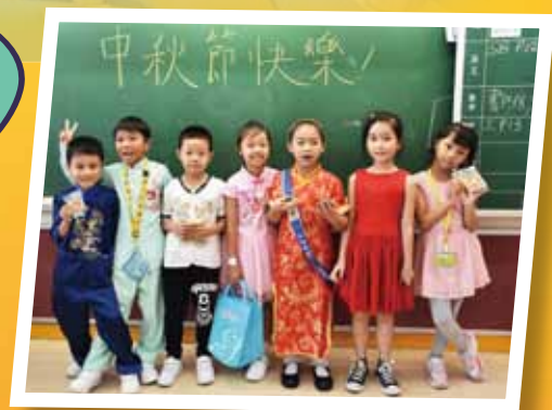
穿上漂亮華服的同學同慶中秋節