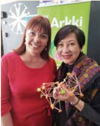
Founder of Arkki School of Architecture