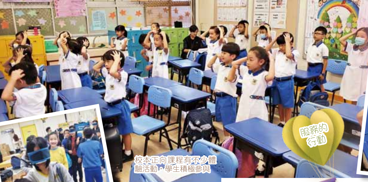
校本正向課程有不少體驗活動，學生積極參與