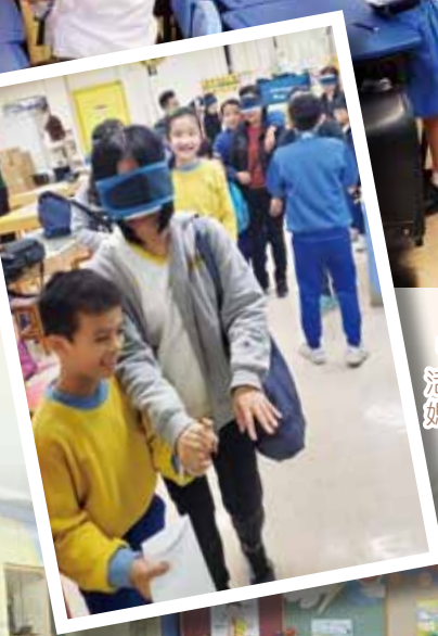
「親子時光」其中一個活動是子女帶着蒙眼的媽媽到一個神秘地方