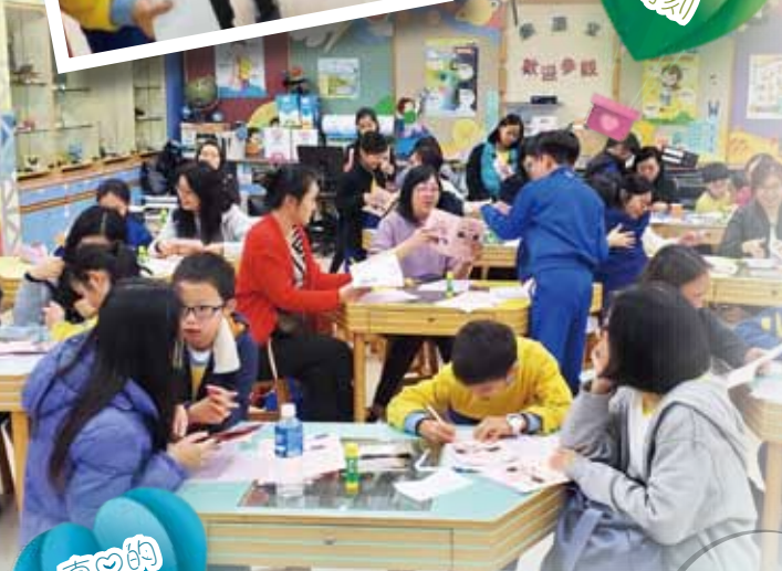
每一對親子都陶醉在「親子時光」之中

學校也向老師、家長、學生宣傳「5種愛的語言」，包括「肯定的言語」、「服務的行動」、「真心的禮物」、「精心的時刻」和「身體的接觸」，期望大家可以使用不同的形式向身邊的人表達真愛之情。今年學校也會繼續舉行很受歡迎的「親子時光」活動，讓家長跟子女有最難忘的一刻。