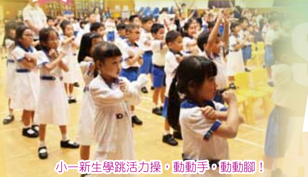
小一新生學跳活力操，動動手，動動腳！