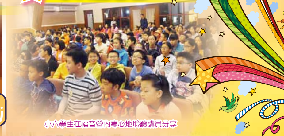
小六學生在福音營內專心地聆聽講員分享