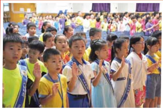
Salute! 領袖生們宣誓，承諾在工作崗位全力以赴