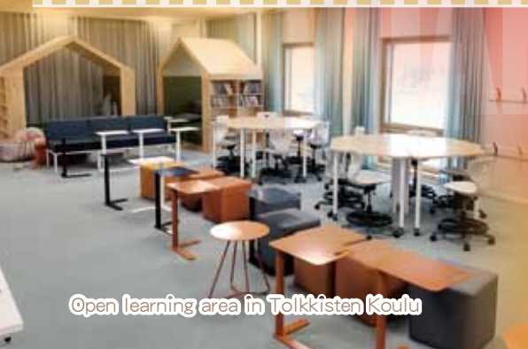
Open learning area in Tolkkisten Koulu

After the visit, they think that Finland's education system is very flexible. It is up to the teachers to choose the best way to help students learn. Teachers learn to respect their students and understand their unique needs to create a comfortable and flexible learning space. Principal Choi and Miss Lo felt the love and care from the government. In the digital environment of the 21st century, people may not have their own space to work in. In Tolkkisten Koulu, students and teachers are preparing for their future from a very early age.