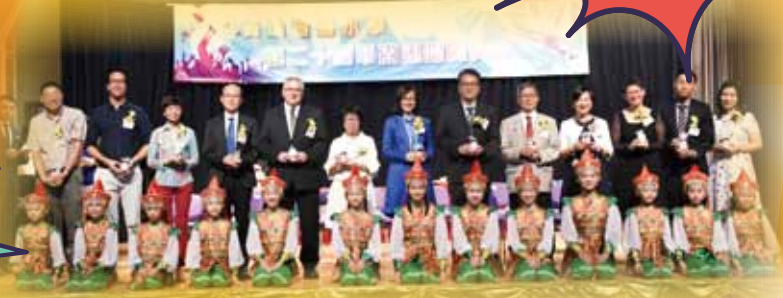
可愛的舞蹈員為嘉賓們致送紀念品