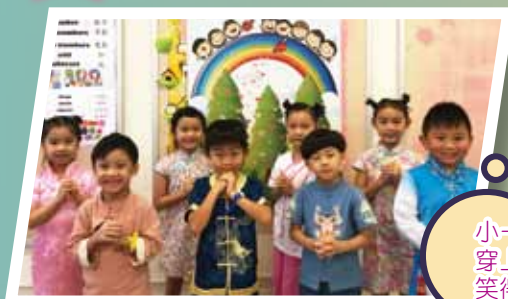
小一學生在中秋佳節穿上華服各展美態，笑得多麼甜美！