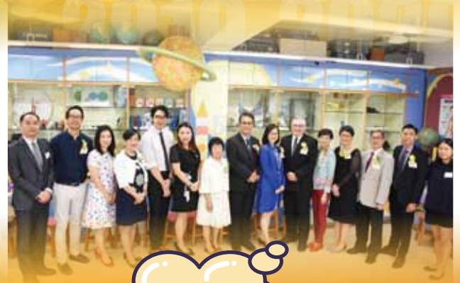
第三十屆畢業禮嘉賓合照，星光熠熠！