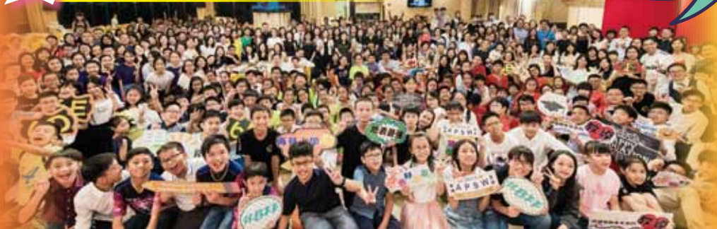
謝師宴後大合照，場面盛大！