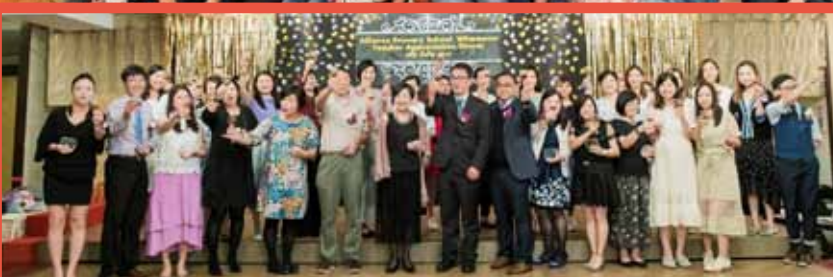
家長們、同學們，一起乾杯！