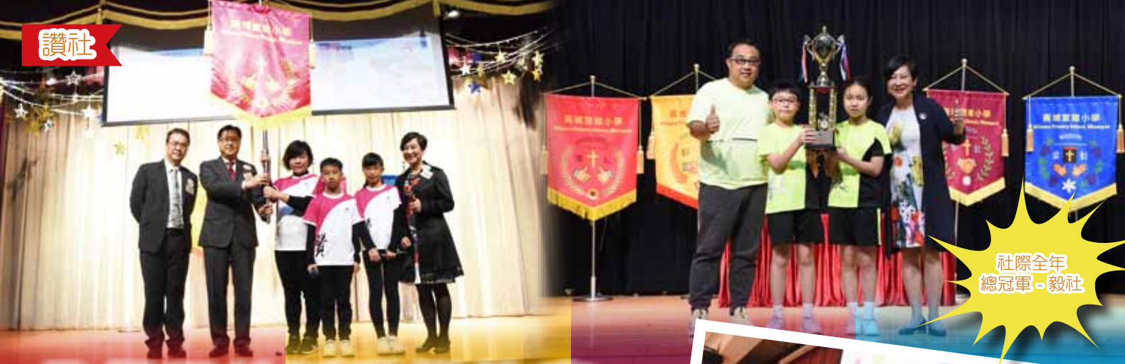
社際全年 總冠軍 - 毅社