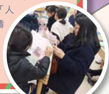
媽媽和子女交換「禮物」，彼此送上「愛的言語」，笑在臉上，甜在心裏

今年學校在小一正式推行校本正向教育課程，小一班主任與香港城市大學正向教育研究室的支援同工一起備課，並於生命成長課及多元智能課推行此課程。課程從「成就感」、「正向情緒」、「正向人際關係」、「投入感」、「人生意義」、「身體健康」六大範疇教導同學。課堂以體驗及分享為主，讓學生可以多做活動，多分享，多聆聽，活出正向生命。