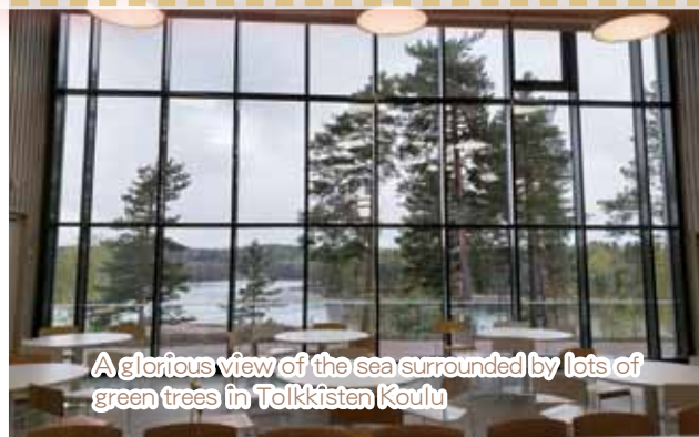
A glorious view of the sea surrounded by lots of green trees in Tolkkisten Koulu