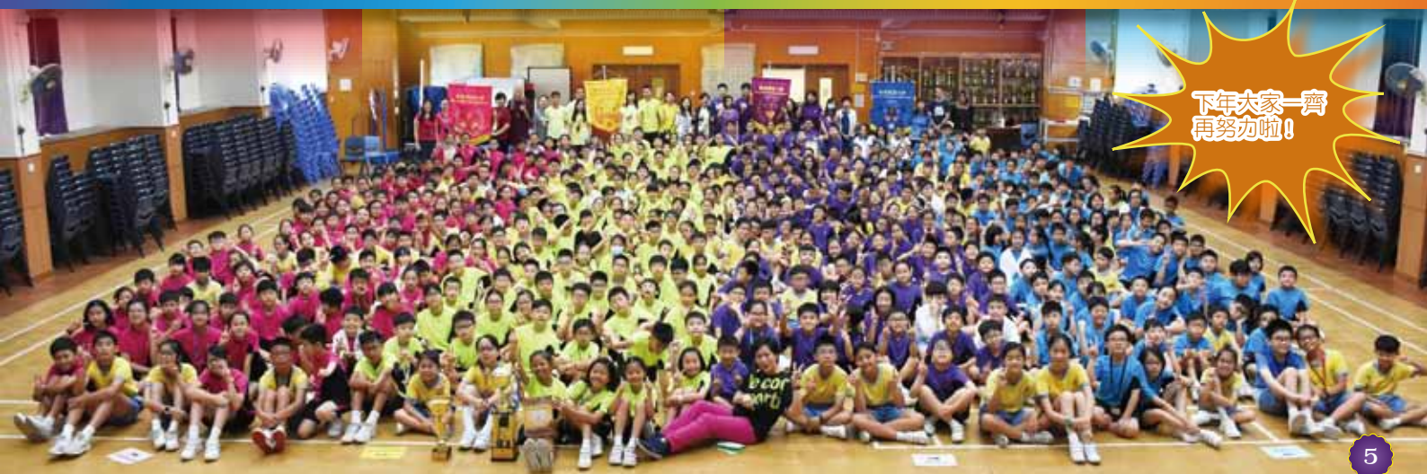
下年大家一齊 再努力啦!