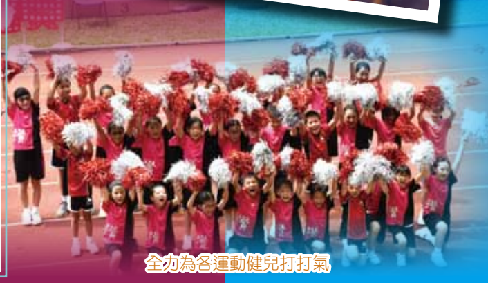
全力為各運動健兒打打氣