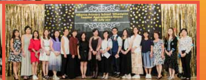
謝師宴籌委與校長來個大合照，大家盛妝打扮