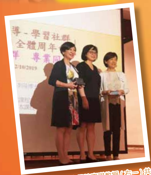
蔡校長與香港大學陳嘉琪教授(右一)共同接受教育局總課程發展主任李陽博士致送的嘉賓紀念品