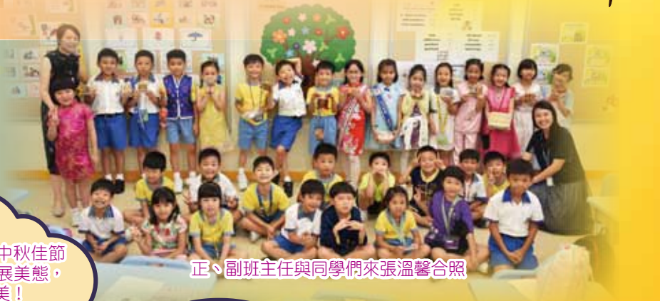
正、副班主任與同學們來張溫馨合照