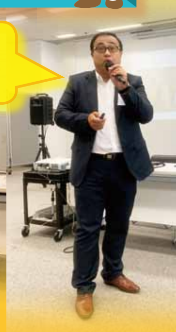
洪良參署理副 校長分享教育 延伸活動