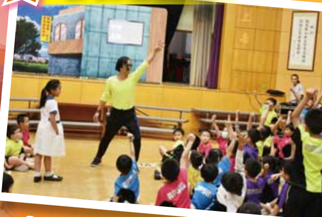
多元智能課時段有幸邀請普通話劇團表演，表演十分互動，同學十分享受