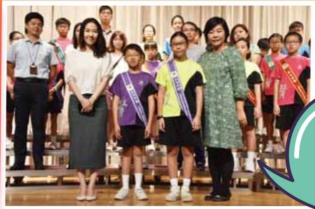
領袖生們英姿勃勃、神氣地接受委任禮