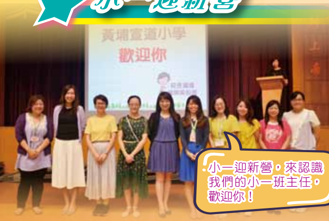
小一迎新營，來認識我們的小一班主任，歡迎你！