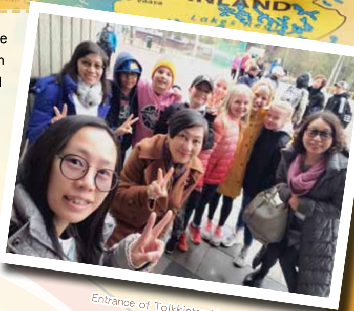
Entrance of Tolkkisten Koulu