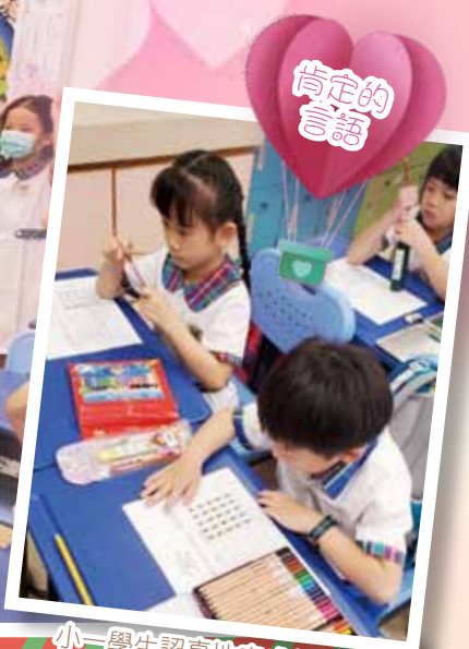
小一學生認真地完成任務卡