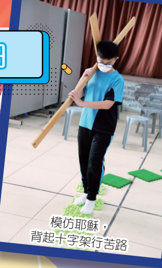
模仿耶穌，背起十字架行苦路