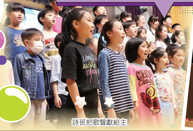
詩班把歌聲獻給主