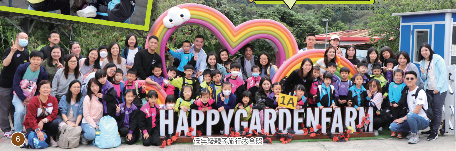
低年級親子旅行大合照