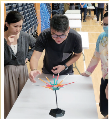
家長們一起玩小遊戲