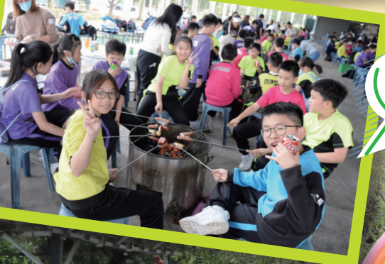
高年級同學正在燒烤