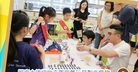
展室大使協助來賓用舊玩具製作飾物