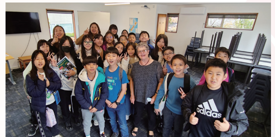
Photo at Middleton Grange School

New Zealand's landscape served as a backdrop for unforgettable outdoor activities. Our students embarked on thrilling hikes, conquering trails that unveiled breathtaking vistas and immersing themselves in nature's splendor. A heart-pounding speed boat ride allowed them to feel the exhilaration of gliding across crystal-clear waters. A visit to the local zoo provided an up-close encounter with diverse wildlife, fostering an appreciation for conservation efforts.