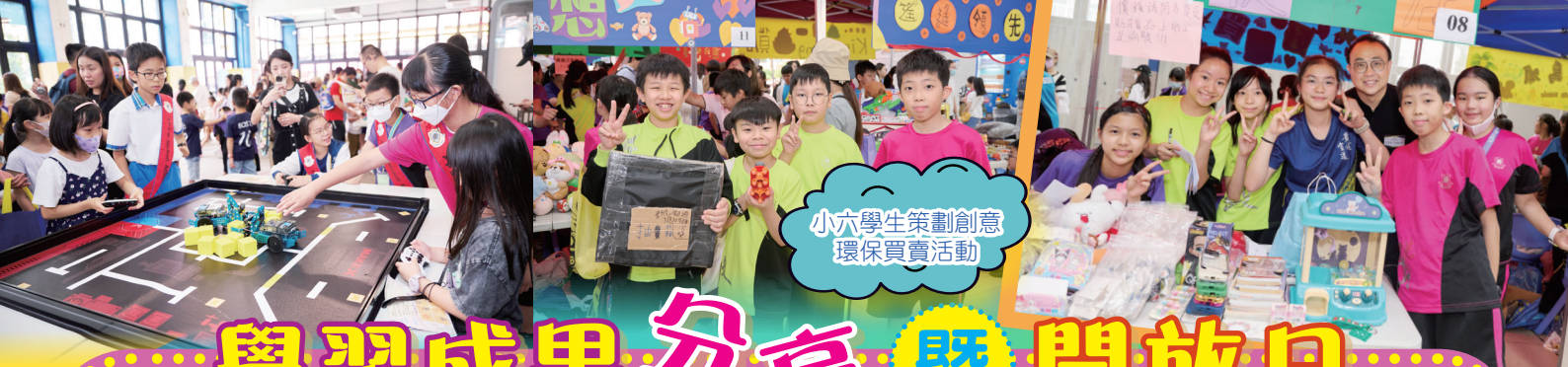
小六學生策劃創意環保買賣活動