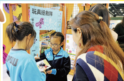
同學於「學與教博覽2023」中向公眾分享創意