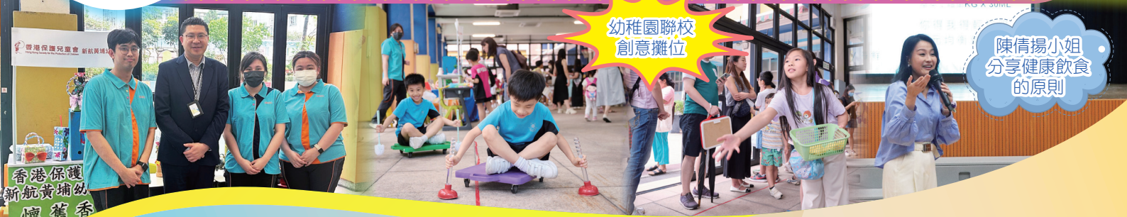
幼稚園聯校創意攤位