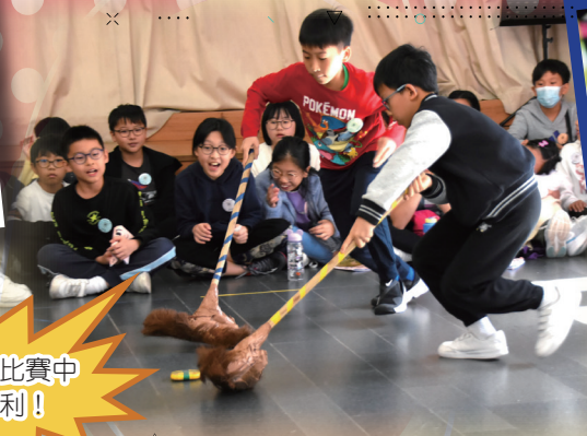
在掃把球比賽中爭取勝利！