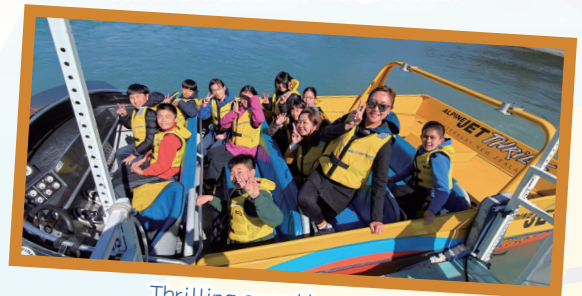
Thrilling speed boat ride

This study tour was a transformative experience, fostering personal growth, resilience, and global awareness. The students returned with a wealth of knowledge, unforgettable memories, and a broader perspective of the world. The school takes pride in their accomplishments and extends gratitude to the teachers and parents who made this remarkable journey possible.