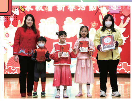
很多同學精心打扮出席新春活動