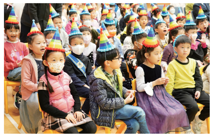
小一同學戴上色彩繽紛的生日帽