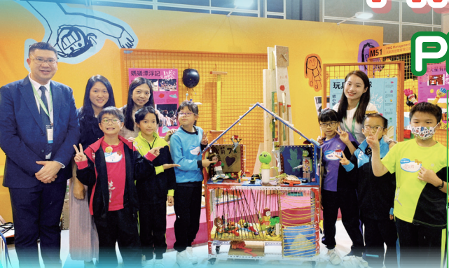
李校長、冼副校一同陪伴學生出席「學與教博覽2023」

本年度有二十三位三至四年級的同學參加由 PMQ Seed 舉辦的「PMQ Seed - KIDS CONNECT 童友引力 校園計劃」，參與同學先完成四星期的「玩具再生」工作坊，認識垃圾污染的成因與影響，並透過學習回收玩具，了解回收的過程及限制。另外，他們亦體驗了設計思維的過程，分組創作流動車，最後更邀請家長們蒞臨一同分享他們的成果。此外，參與同學於「學與教博覽 2023」中擔任「小小導賞員」，與大眾分享創作的過程、學習成果和感受，是一次非常有趣和難得的經驗。他們亦於學校開放日展室分享「玩具再生」工作坊的成果，吸引眾多來賓及家長，並協助他們用舊玩具製作飾物。