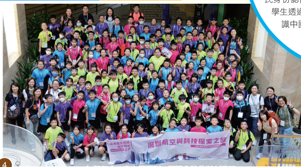
四年級師生一齊出發深圳，認識內地的科創發展。

本校在 2024 年 4 月 19 日（星期五）安排全級四年級學生參加「粵港澳大灣區城市探索之旅」（2023/24）——深圳航空與科技探索之旅，目的是配合學校課程，為學生提供不同的學習經歷，以認識大灣區城市的歷史文化、科技、航空、經濟、城市規劃及自然生態等方面的發展，並了解香港和相關內地城市在大灣區建設中的優勢和發展空間，以提升學生的國民身份認同。本校獲教育局資助有關活動，讓學生透過實地交流，將知識與體驗結合，認識中國的科技發展及大灣區的情況。