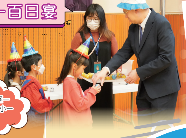
李校長逐一送禮物給小一同學