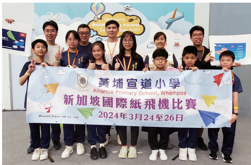
STREAM 航空校隊代表隊帶隊老師及家長於新加坡 Science Centre 的比賽場地合照

比賽過後，我們的學生更有機會參觀了新加坡的一些與 STEAM 有關的建設，同時，他們還有機會體驗到新加坡的文化，品嚐當地的美食，同學們都感到大開眼界，獲益良多呢！