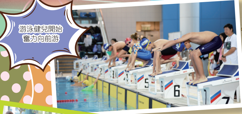
游泳健兒開始奮力向前游