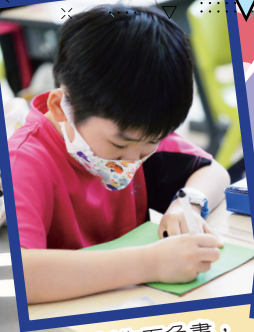
專心製作五色書，向人傳福音