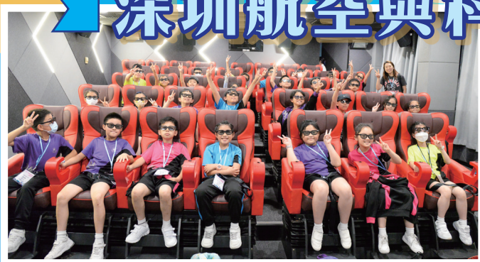
一起觀看 4D 電影，認識國家的航天發展。

本校在 2024 年 4 月 19 日（星期五）安排全級四年級學生參加「粵港澳大灣區城市探索之旅」（2023/24）——深圳航空與科技探索之旅，目的是配合學校課程，為學生提供不同的學習經歷，以認識大灣區城市的歷史文化、科技、航空、經濟、城市規劃及自然生態等方面的發展，並了解香港和相關內地城市在大灣區建設中的優勢和發展空間，以提升學生的國民身份認同。本校獲教育局資助有關活動，讓學生透過實地交流，將知識與體驗結合，認識中國的科技發展及大灣區的情況。