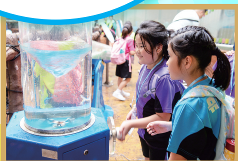
同學們參觀深圳科學館，體驗科學探索的樂趣。