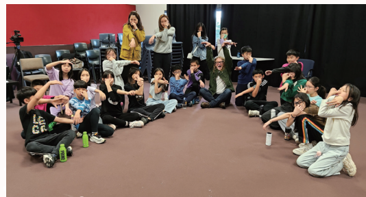
Students enjoying drama lesson

During their time at Middleton Grange School, our students had the privilege of learning from the dedicated teachers at the institution. The classrooms became vibrant spaces of discovery as they delved into a myriad of subjects. Engrossing history lessons unveiled the captivating stories of the country's past, while cultural lessons provided a deeper understanding of New Zealand's rich heritage. English and drama classes nurtured language skills and creativity, fostering self-expression and confidence.