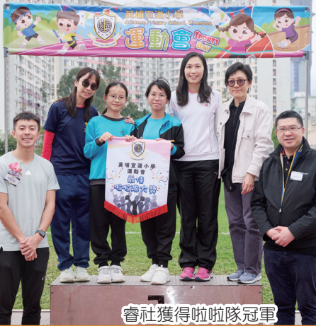
睿社獲得啦啦隊冠軍