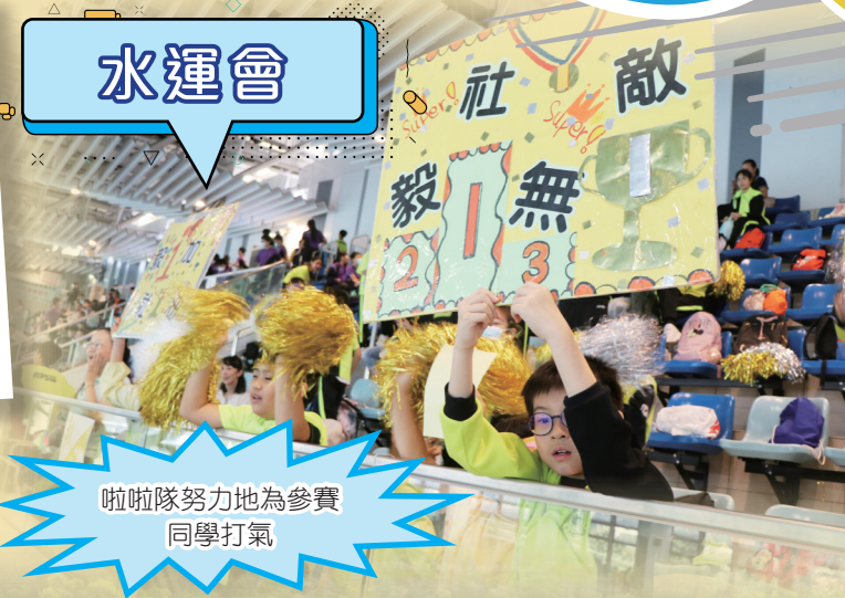
啦啦隊努力地為參賽同學打氣