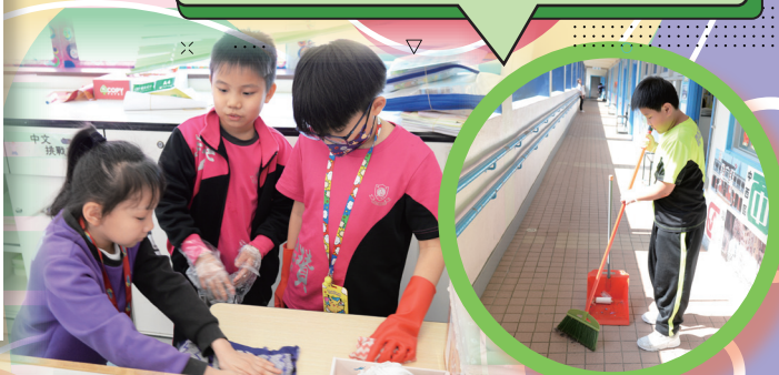
同學一同清潔課室