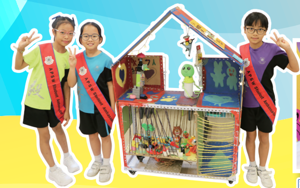
充滿創意的流動車!

本年度有二十三位三至四年級的同學參加由 PMQ Seed 舉辦的「PMQ Seed - KIDS CONNECT 童友引力 校園計劃」，參與同學先完成四星期的「玩具再生」工作坊，認識垃圾污染的成因與影響，並透過學習回收玩具，了解回收的過程及限制。另外，他們亦體驗了設計思維的過程，分組創作流動車，最後更邀請家長們蒞臨一同分享他們的成果。此外，參與同學於「學與教博覽 2023」中擔任「小小導賞員」，與大眾分享創作的過程、學習成果和感受，是一次非常有趣和難得的經驗。他們亦於學校開放日展室分享「玩具再生」工作坊的成果，吸引眾多來賓及家長，並協助他們用舊玩具製作飾物。