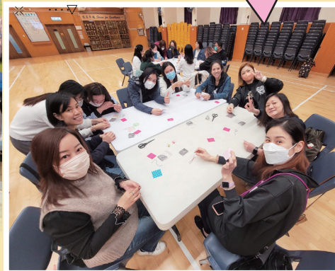
互相支持，互相陪伴