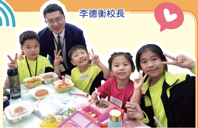
李校長鼓勵小五學生照顧小一學弟學妹