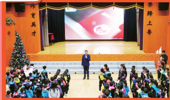
每周由學生、老師和李校長輪流分享有關價值觀教育的內容，以提升大家對國民教育的認識