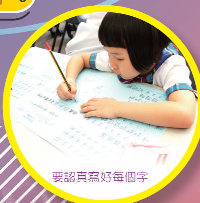
要認真寫好每個字