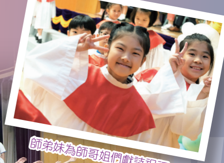
師弟妹為師哥姐們獻詩祝福