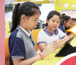
佛山市洗可澄紀念學校學生與本校學生一起學習