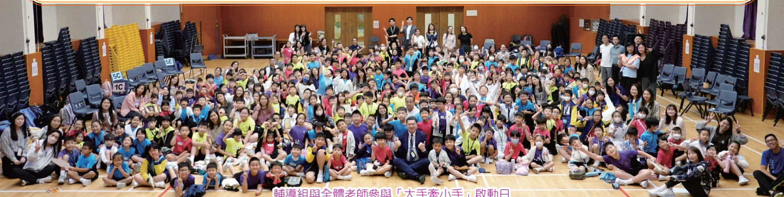
輔導組與全體老師參與「大手牽小手」啟動日

我們將重新檢視和優化現有的課程規劃，以滿足孩子的不同學習需要。我們的目標是讓每位孩子都能在自主學習的環境中發揮潛能，獲得知識與技能。當中包括多元的教學模式，課堂中安排更多動手做、互動討論和孩子主動探究學習，激發孩子的好奇心和創造力，以配合學校推動的 STREAM 教育。另外配合電子平台及自攜平板電腦的運用，讓孩子把預習、課堂中摘錄筆記及課堂中透過電子平台的互動和課後延伸作整合及養成習慣，以助孩子能更有系統地主動學習。此外，我們會持續在課堂中按孩子的興趣和能力制訂學習計劃，以在課堂中有效照顧孩子的學習多樣性，確保他們能夠有效地掌握知識。另繼續加強營造除「兩文三語」以外的不同語境，並通過不少海外和內地交流、考察和體驗，讓孩子身體力行來探索知識。另繼續加強閱讀氛圍的建立，我們將會藉 2025 大阪世界博覽會的舉行，當中我們會配合大會主題及近日「港產」熊貓的社會熱話，營造一系列以保育及科技為題的閱讀及 STREAM 活動來提高孩子的閱讀、語文和 STREAM 範疇的興趣。