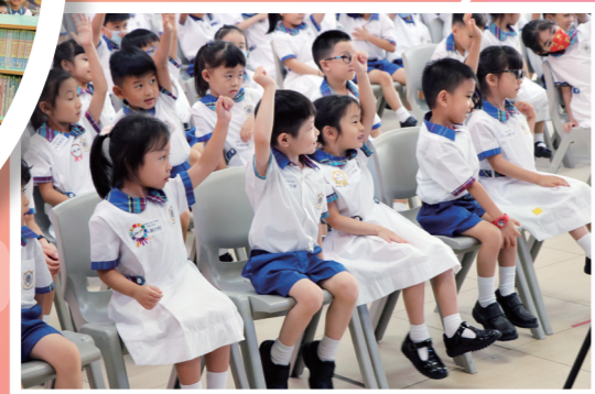
同學積極參與活動