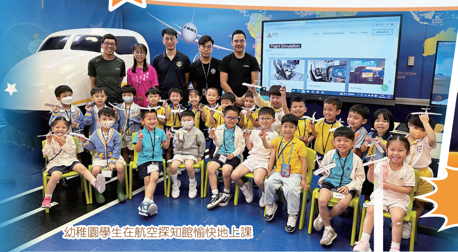
幼稚園學生在航空探知館愉快地上課