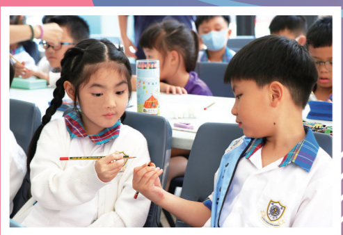
握筆要有正確的姿勢