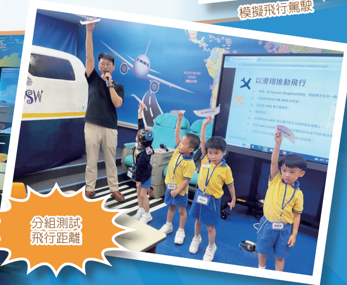
分組測試飛行距離