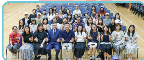
歡迎我們的同行者——家長義工們