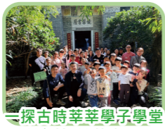
探古時莘莘學子學堂所在地(鏡蓉書屋)