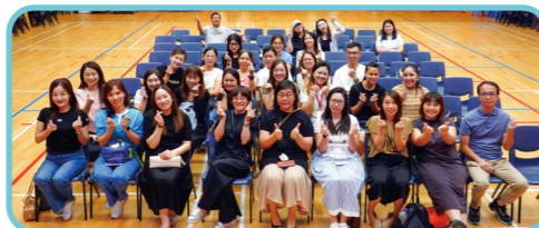
年終家長義工茶聚，答謝家長們的辛勞