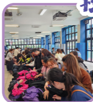
家長們支持校服義賣活動