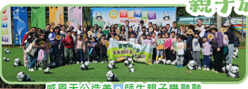
感恩天造地設，師生親子樂融融