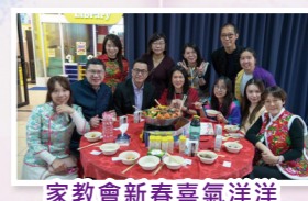
家教會新春喜氣洋洋