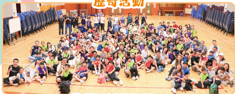
超過150位家長和學生參與