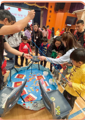
新春攤位，家長及同學玩得投入