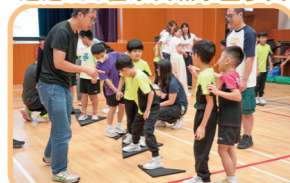
大型七巧板——鬥智鬥力