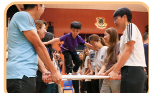
信任天梯——建立彼此的信任