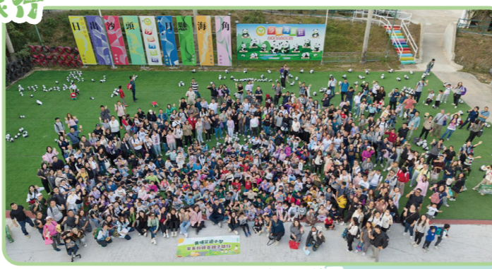
親子旅行尾聲來張航拍照