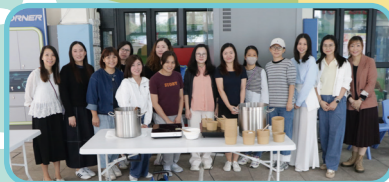
小一主題學習齊搓湯圓