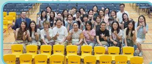
午膳家長義工全年為同學們無私付出