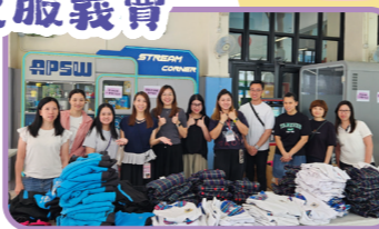
家長義工們已準備好校服義賣活動了