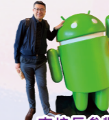
李校長參觀美國矽谷

更令我動容的是默默奉獻的家長義工隊。無論是在午膳時間悉心照料孩子、協助戶外探訪，還是在圖書館裡細緻整理書架，您們的參與不僅優化了學習環境，更以身作則，成為孩子們學習「服務與承擔」的最好榜樣。