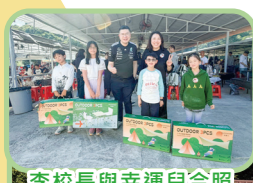
李校長與幸運兒合照