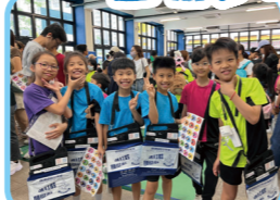
同學們精神抖擻，整裝待發