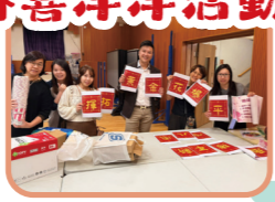
祝大家福杯滿溢，學業進步