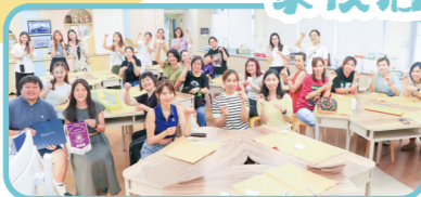
家長螺絲工作坊大合照