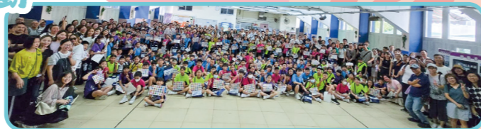
基督少年軍賣旗，本校獲得「最具人氣參與獎」